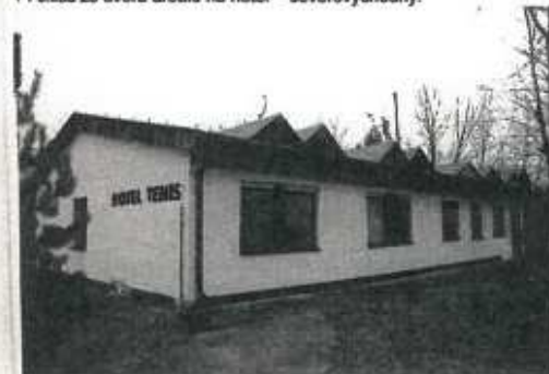
▼ Pohľad zo dvora areálu na hotel - severovýchodný.