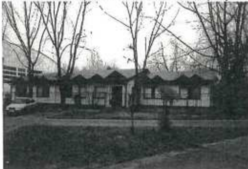
▼ Pohľad z Ďumbierskej ulice na budovu hotela - severozápadný.