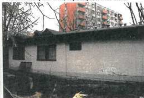
▼ Pohľad zo zadnej časti dvora, na juhozápadné krídlo hotela.