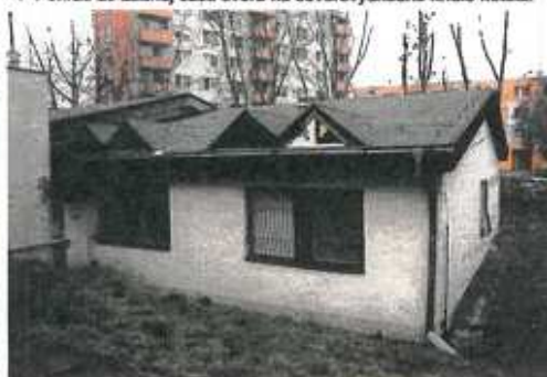
▼ Pohľad zo zadnej časti dvora na severovýchodné krídlo hotela.