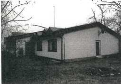
▼ Pohľad zo dvora tenisového areálu na hotel - západný.